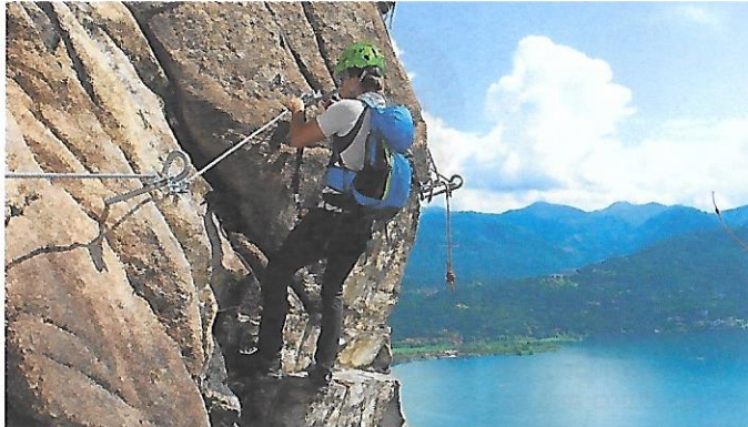
FERRATA DEI PICASASS