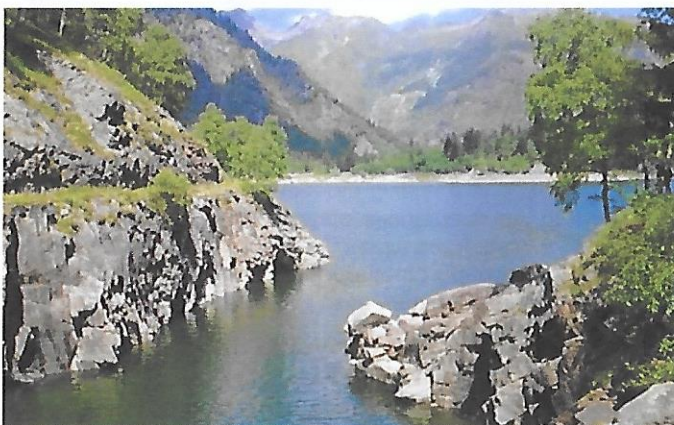
LAGO DI ANTRONAPIANA